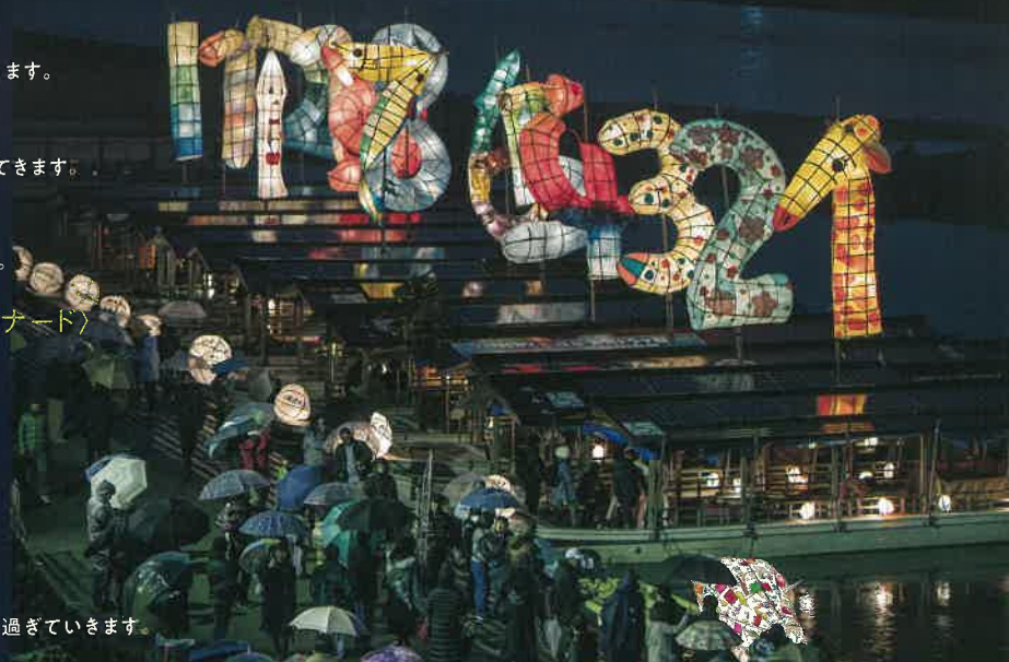
フォトコンテスト2019グランプリ