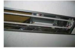
器具内に古い安定器が残っている例