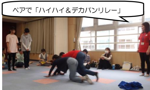
ペアで「ハイハイ&デカパンリレー」