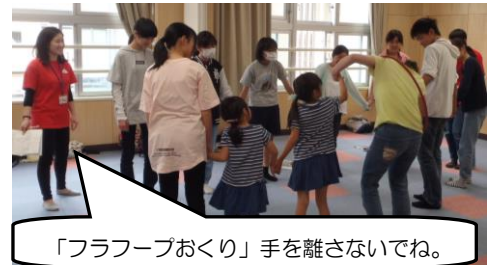
「フラフープおくり」手を離さないでね。