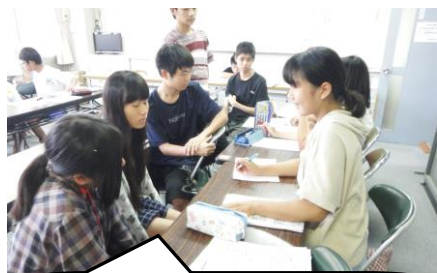
Bチーム、どんな反論をしようか、話し合いも真剣です。

リーダーが判定しました。19名のジュニアが参加し、A・Bのチームを編成し、研修しました。ディベートの流れやルールの説明を受け、スタートです。両チームとも、まずは立論のために話し合います。3分間、様々な視点で意見を出し合うジュニアの姿に感心しました。