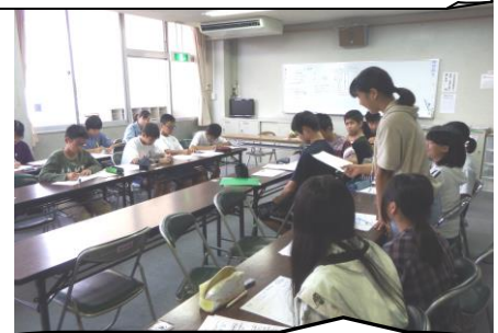
相手の主張を聞きながら、メモをしたり、次の反論を考えたりしました。