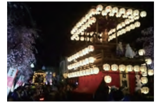
岐阜まつりの「宵宮」