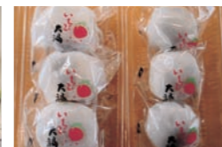
■冬季限定「いちご大福」