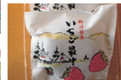
■当駅イチオシ「いちご最中」