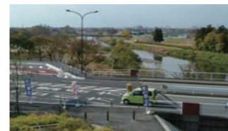
■屋上広場から眺める境川の流れ

駅舎の屋上は四季折々の花と緑でいっぱい。照り注ぐ太陽、澄み切った青空、さわやかに吹き抜ける風を肌を感じながら、癒しのひとときを満喫してください。発電用の風車も印象的です。