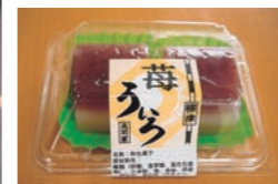
■当駅限定「いちごう」