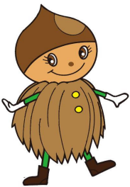
ぎふ食育キャラクター ←マロミン