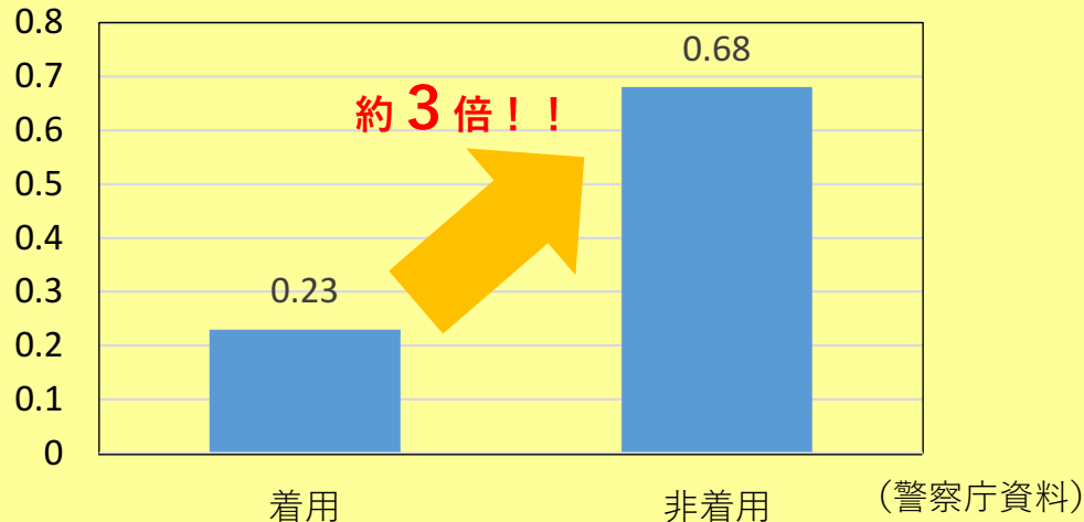
(%) ヘルメット着用状況別の致死率比較（令和2年）