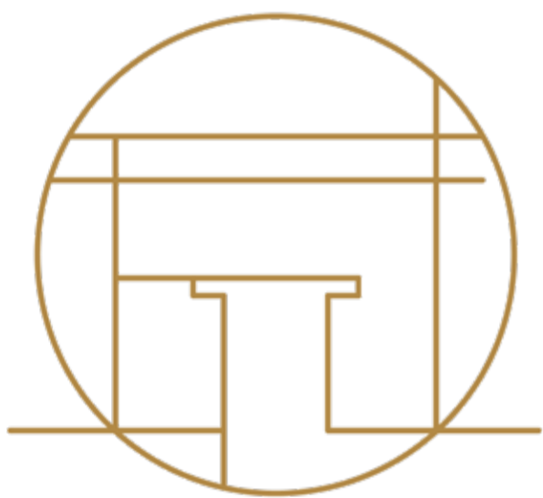
岐阜市歴史博物館

歴史ある戦国城下町のイメージとして、家紋をベースにデザインしました。リニューアルコンセプトであるぎふの魅力を深められる場所として岐阜市歴史博物館の建物外観を意匠として取り込んでいます。