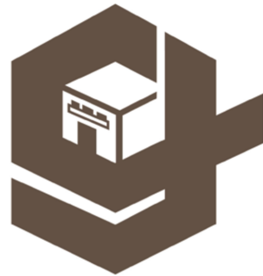
岐阜市歴史博物館 Gifu City Museum of History

英文"gifu"の「g」+「建物(岐阜市歴史博物館)シルエット」を組み合わせ建物が浮かび上がり『岐阜市歴史博物館』の過去と未来をつなぐ機能を表現。岐阜の歴史・文化に親しみ、より一層親しみのある博物館として人々に知っていただくことを強調。