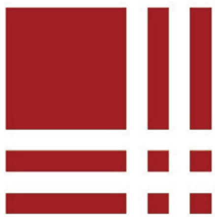
岐阜市歴史博物館 GIFU CITY MUSEUM OF HISTORY

縦横4つの「! (エクスクラメーションマーク)」と、岐阜市の市章である「井」を組み合わせたロゴマークです。たくさんの「!」に出会える岐阜市歴史博物館という意味を込めてつくりました。