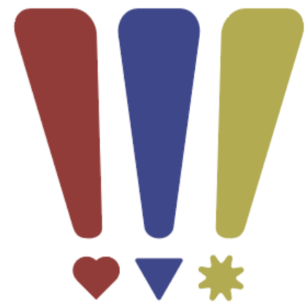
岐阜市歴史博物館 Gifu City Museum of History

「気づく・深める・楽しむ」をビックリマークで覚えやすく、親しみやすく表現しました。上が広がる形には、子どもたちに様々な驚きを経験し、知見を広げて成長をして貰いたいという想いを込めています。