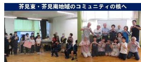
4月7日(火) 藍東学園開校式