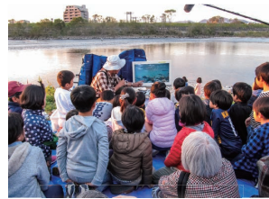
アユの産卵観察会