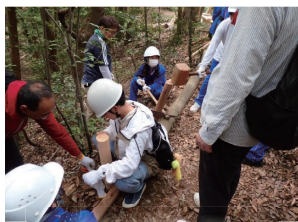
第3ブロック 青少年育成市民会議