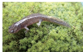
ヤマトサンショウウオ 岐阜市絶滅危惧Ⅰ類