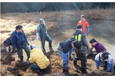
「小さな自然再生」 (大洞の湿地再生)