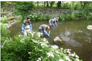
アズマヒキガエル(岐阜市絶滅危惧Ⅰ類) の卵のう保全