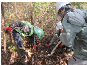
大洞の里山つくろう会