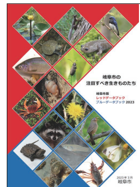
岐阜市の注目すべき生きものたち 岐阜市版レッドデータブック ブルーデータブック 2023