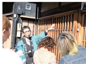
ぎふ・長良川めぐるツアーズ