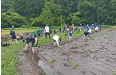
達目洞自然の会(田植え体験)