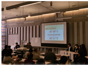
岐阜市生物多様性シンポジウム

かけがえのない自然環境を次世代へとつなげるためには、市民一人ひとりの協力が必要です。今日からできる身近なアクションを紹介します。