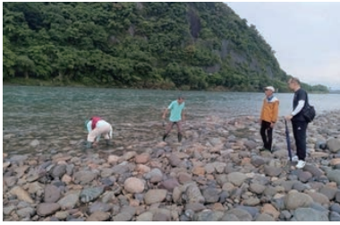
長良川流域環境ネットワーク協議会 (長良川流域一斉環境調査)