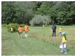
岐阜市こどもエコクラブ