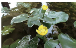
ヒメコウホネ 岐阜市絶滅危惧Ⅰ類

市内には多様な環境があり、それぞれの環境に適応した5,939種もの動植物が生息・生育しています。条例で守られているヒメコウホネやヤマトサンショウウオ、ホトケドジョウ以外にも貴重な動植物が生息・生育しています。