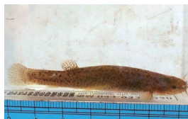
ホトケドジョウ 岐阜市準絶滅危惧