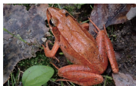
ニホンアカガエル 岐阜市絶滅危惧Ⅰ類