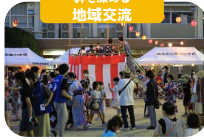
絆を深める地域交流