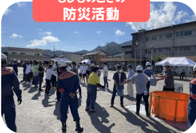
もしものときの防災活動