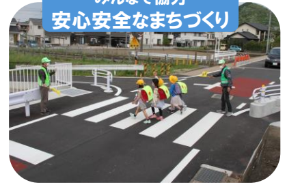
みんなで協力 安心安全なまちづくり