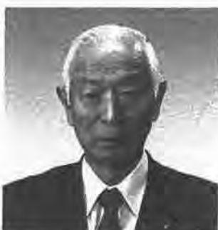
全国市議会議長会会長 山形市議会議長