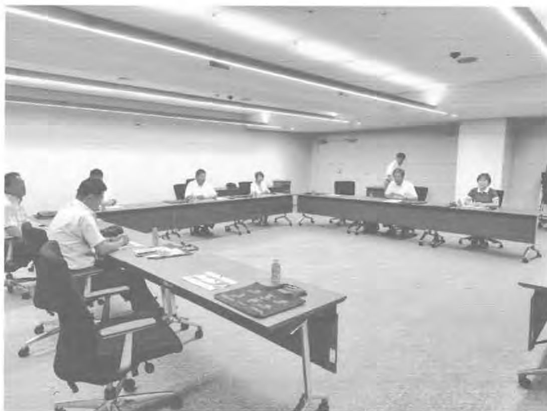
「長野市役所で説明を聞く行政視察団一行」

令和6年度のこの事業では、長野市に居住している小学1年から中学3年までの子どもの養育者を対象とし、子ども1人当たり3万円分の電子ポイントを配布して習い事や体験プログラムに使ってもらおうというもので、対象とするプログラムも778あり、子どもたちにとって様々な学びの機会を得る良いきっかけになるのではと思った。