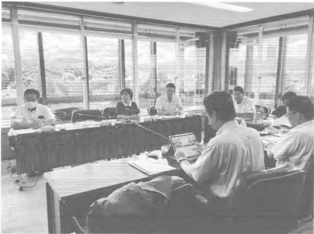
「金沢市役所で説明を受ける行政視察団一行」

金沢市の指定ごみ袋のサイズは、5リットル袋から45リットル袋まで5つのサイズに分かれており、家族の数や生活スタイルなどによって種類を増やしている点などが勉強になった。