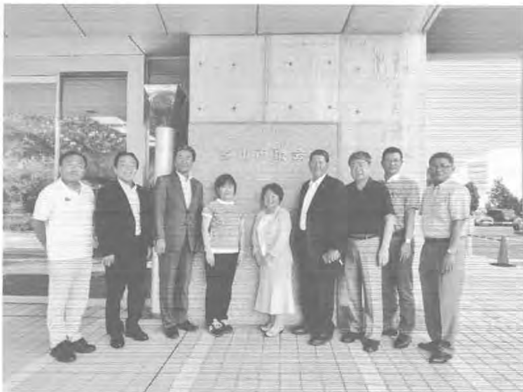
「富山市役所での行政視察団一行」

地方からの、たった3人の看護師さんが始めたことが全国に影響を及ぼしたところが勉強になった。