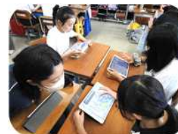
安全教育的様子（イメージ）

△ 市内全小学校で導入されているタブレット用の教育ICTツール、ロイロノートによりワークショップの活動内容と、話し合われた危険箇所について、資料を作成し、学校に提供し、安全教育に役立てていただきます。