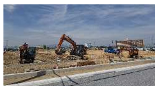
(株)ジーケーエスの工事の様子