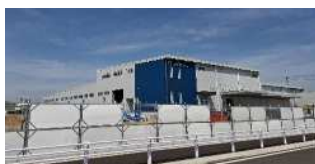
(株)岡本の工事の様子