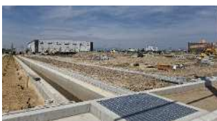
(株)スーパーメイトの工事の様子