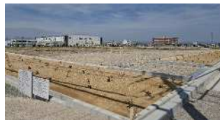
(株)光製作所の工事の様子