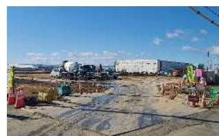
(株)ジーケーエスの工事の様子