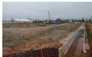
(株)光製作所の工事の様子