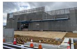
(株)岡本の工事の様子