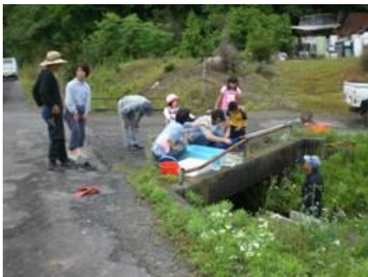
水路の生き物調査

現在、１４組織（上城田寺、打越、太郎丸、福富、春近・溝口、岩利、長森、芥見、東改田、岩田・岩滝、三輪、方県南、下城田寺、安食）がこの事業に取り組んでいます。