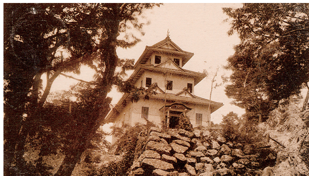
初代の復興天守の絵葉書

所で、建物は木造トタン葺きの3層、内部は写真等の記録はないですが、吹き抜けになっており、ハリボテ状の構造であったといわれています。建築の際、見学ルートとなる登山道の改修も検討されたようです。