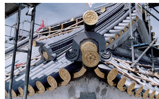
平成の大改修

平成9(1997)年に行われた、瓦の葺き替えや外壁の修理などの平成の大改修にあたっては、瓦を山上に運ぶ市民参加型のイベントも開催され、多くの市民が参加しました。