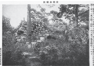
復興天守が建築される前の天守台（明治時代の絵葉書）

岐阜城復興天守の歴史は古く、初代の復興天守は明治43(1910)年の建築で、日本で初めて建設されたと考えられています。建築場所は古地図に復興天守が建築される前の天守台と記載のあった箇所