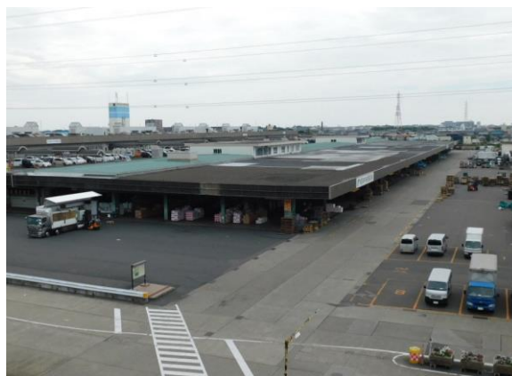
建物の用途及び構造（令和5年3月31日現在）