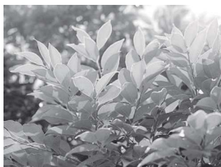
市の木 つぶらじい

この地は古くは「井の口」と呼ばれ、織田信長が「岐阜」の名を全国に広めた。この由緒あるいわれに基づき、「井の口」の「井」をもって本市の市章と定めたものである。 (明治42年8月27日制定)