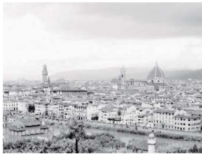
姉妹都市／フィレンツェ市

盟約調印年月日 昭和53年2月8日 国名 イタリア共和国 人口 約36万人 面積 102 km 2 気候 地中海性気候 産業・特産物等 手工芸品・ファッション・観光産業