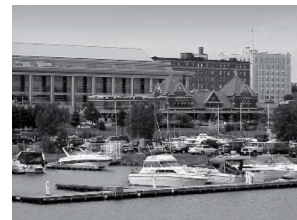
姉妹都市／サンダーベイ市

盟約調印年月日 平成6年3月22日 国名 オーストリア共和国 人口 約10万人 面積 8.2km 2 気候 西岸海洋性気候 産業・特産物等 農業機械・椅子・靴の製造・ファッション産業