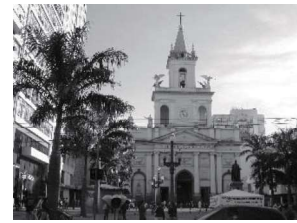
姉妹都市／カンピナス市

盟約調印年月日 昭和54年2月21日 国名 中華人民共和国 人口 約1,194万人 面積 16,596km 2 気候 温暖湿润気候 産業・特産物等 茶・生糸・絹織物・観光・IT産業