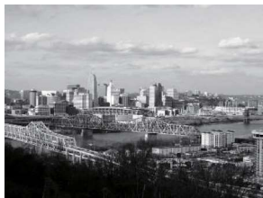
姉妹都市／シンシナティ市

盟約調印年月日 昭和57年2月22日 国名 ブラジル連邦共和国 人口 約121万人 面積 796km 2 気候 サバナ性気候 産業・特産物等 IT産業・電気機械類・農業