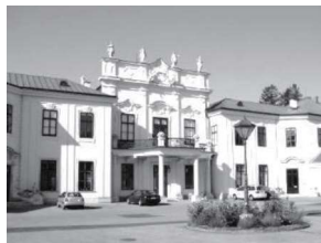
姉妹都市／ウィーン市 マイドリング区

盟約調印年月日 昭和63年5月11日 国名 アメリカ合衆国 人口 約30万人 面積 206km 2 気候 温暖湿润気候 産業・特産物等 機械・化学工業・航空宇宙産業