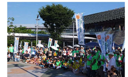
社会を明るくする運動の様子