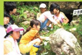
(一例) 上城古墳の保存と清掃