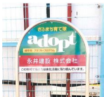
▲団体名：永井建設（株） 場 所：宮北公園内