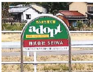
▲団体名：（株）SEIWA 場 所：椿洞地内

サインボードは、新規参加団体に限らず、すでにアダプト・プログラム活動に参加いただいている団体でも設置していただくことが出来ます。