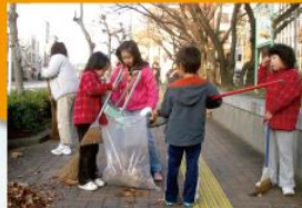
(一例) 町内の清掃活動