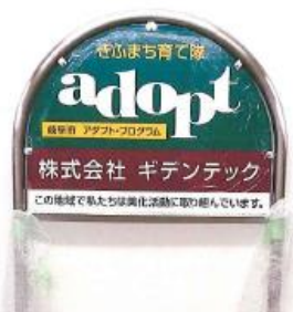
▲団体名：（株）ギデンテック 場 所：光樹町3番地地内