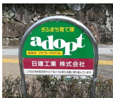
▲団体名：日建工業（株） 場 所：大宮町2丁目地内