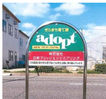
▲団体名：（株）日新ブリッジエンジニアリング 場 所：萱場南1丁目地内