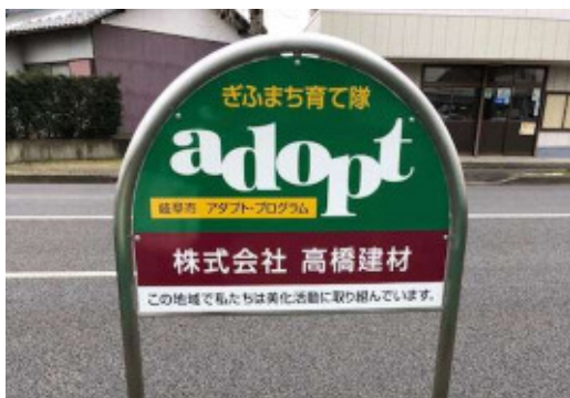
▲団体名：株式会社高橋建材 場 所：岐阜市則武中2丁目地内