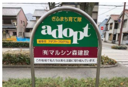
▲団体名：(有) マルシン森建設 場 所：岐阜市本郷町2丁目地内