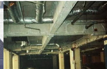
鉄骨を被覆して保護 石綿含有耐火被覆材