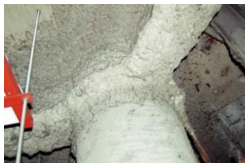
柱や梁に施工 吹付け石綿