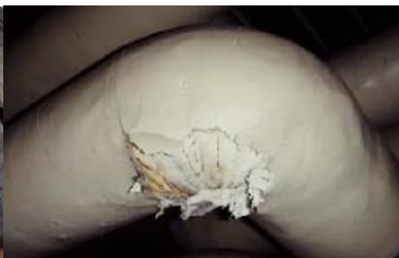
エルボ部に使用 石綿含有保温材