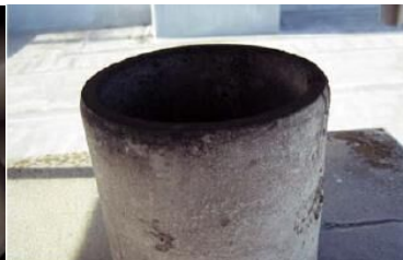
煙突の内側に使用 石綿含有断熱材