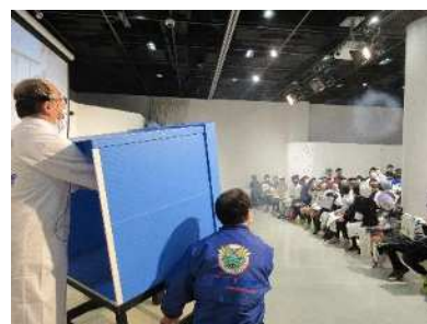
サイエンスショー