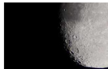
星を見る会（天文係職員撮影）