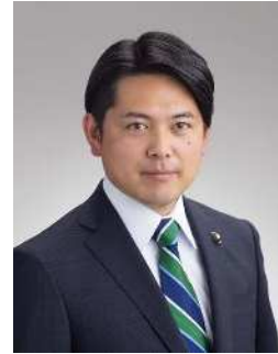
岐阜市長 柴橋 正直