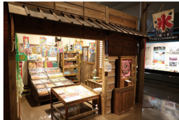
▲駄菓子屋さん(昨年度展示風景)

150年から40年くらい前に使われていた「ちょっと昔」の道具を一室に集め、当時の暮らしを紹介します。写真は、昭和30年代から40年代のまちかどを再現したコーナーで、駄菓子屋さんには昔懐かしい駄菓子やおもちゃが所狭しと陳列されています。