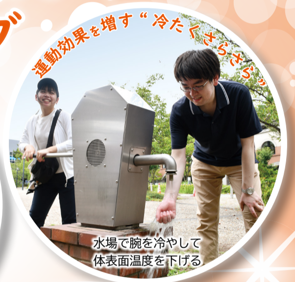
運動効果を増す“冷たくさらさら”