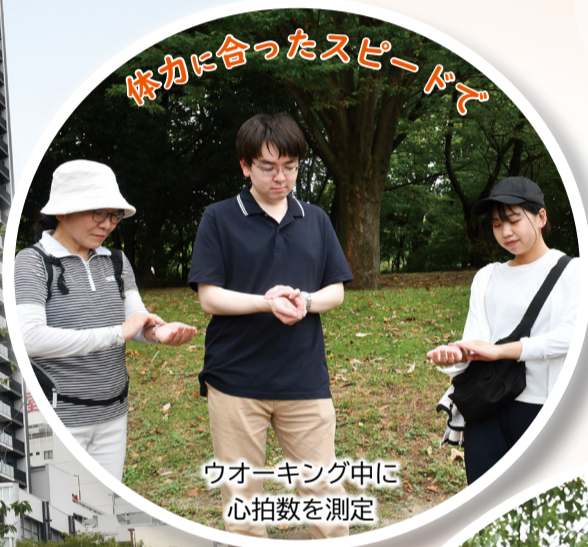
体かに合ったスピードで