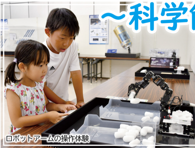
ロボットアームの操作体験