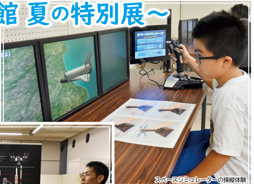
スペースシミュレーターの操縦体験