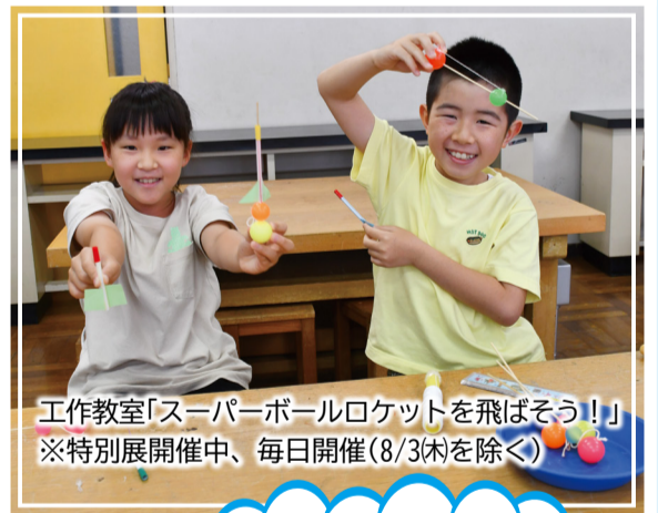
工作教室「スーパーボールロケットを飛ばそう！」 ※特別展開催中、毎日開催(8/3(木)を除く)

「空を飛んでみたい」という、誰もが一度は見た夢。科学館では、こうした夢の実現に向け、発展してきた航空・宇宙に関する科学技術をテーマとした特別展を、8月31日(木)まで開催しています。空と宇宙について楽しみながら学ぶことができますので、ぜひ、ご家族、お友達と一緒にどうぞ。