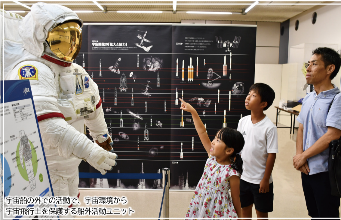
宇宙船の外での活動で、宇宙環境から宇宙飛行士を保護する船外活動ユニット