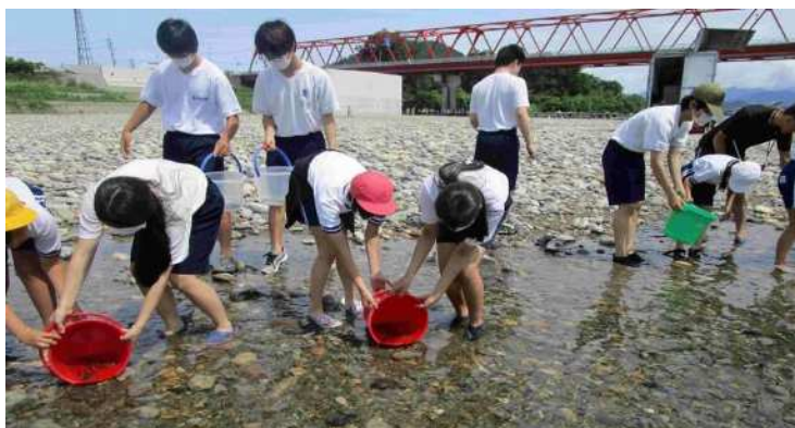
▲ 児童生徒が稚鮎を長良川で放流する姿