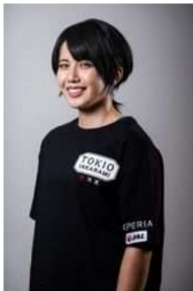
(泉 ひかり 選手)

2021年に日本選手権のスピードランで優勝。CM、TV等多くのメディアに出演しタレントとしても人気。29歳。