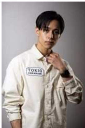
(朝倉 聖 選手)

2019年に日本人初の世界大会優勝を果たす。場所を選ばない軽やかな動きでパルクール界を牽引する存在。24歳。