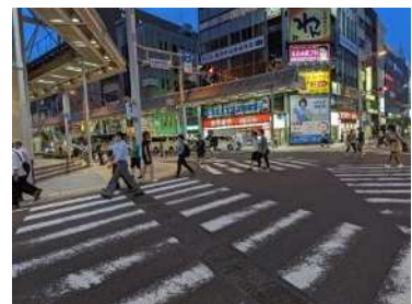
客引きがほとんど見られなくなった 名鉄岐阜駅前スクランブル交差点

【客待ち】 客引き行為をする目的で、その相手方となるべき者を待つ行為で、条例における禁止区域内の違反行為のひとつ。