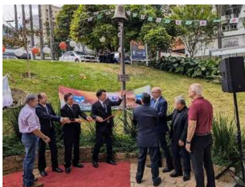
カンピーンナス市での平和の鐘式典の様子

今回の訪問を機に 姉妹都市の絆 をより深め、 世界恒久平和の実現 に寄与することを誓った