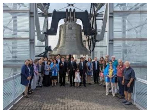
シンシナティ市での平和の鐘式典の様子