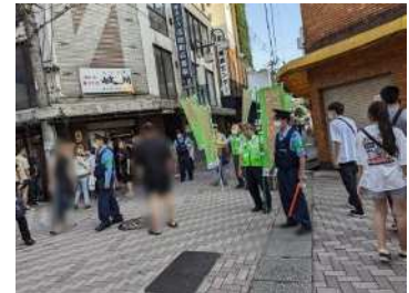
岐阜中警察署・地元関係者による啓発活動

○禁止区域におけるこれまでの累計指導件数は、 指導 213 件、勧告 96 件、命令 82 件、過料 45 件（令和5年8月21日現在）