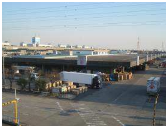
建物の用途及び構造（令和4年3月31日現在）