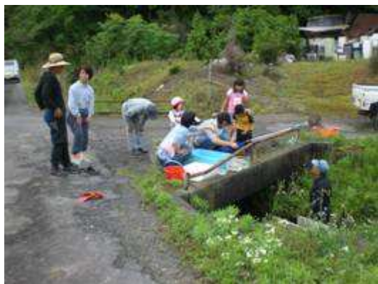
水路の生き物調査

現在、14組織（上城田寺、打越、太郎丸、福富、春近・溝口、岩利、長森、芥見、東改田、岩田・岩滝、三輪、方県南、下城田寺、安食）がこの事業に取り組んでいます。