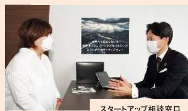
スタートアップ相談窓口

JR岐阜駅と直結する岐阜イーストライジング24内において、リモートオフィスの運営とスタートアップ相談窓口の二本柱としたスタートアップ支援事業を行い、多様なライフスタイルに対応できる労働環境を提供するとともに、起業家数の増加や新たな事業やサービスの創出などを行う。