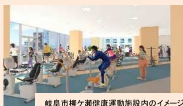
岐阜市柳ヶ瀬健康運動施設内のイメージ

柳ヶ瀬ガラスル35内において、隣接する中保健センターと連携し、健康に対する意識や知識を育み、運動を通じた健康づくりを支援する健康・運動施設を運営する。また、市の施策である都市型のクアオルト健康ウォーキングの拠点として、情報発信やウォーキングの受付を行う。