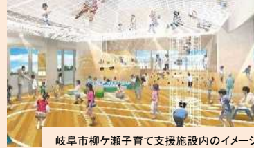
岐阜市柳ヶ瀬子育て支援施設内のイメージ

柳ヶ瀬ガラスル35内において、遊びを通じて子どもの生きる力を養い、次代を担う子どもを育むとともに、子育て家庭を支援するための子育て支援施設を運営する。