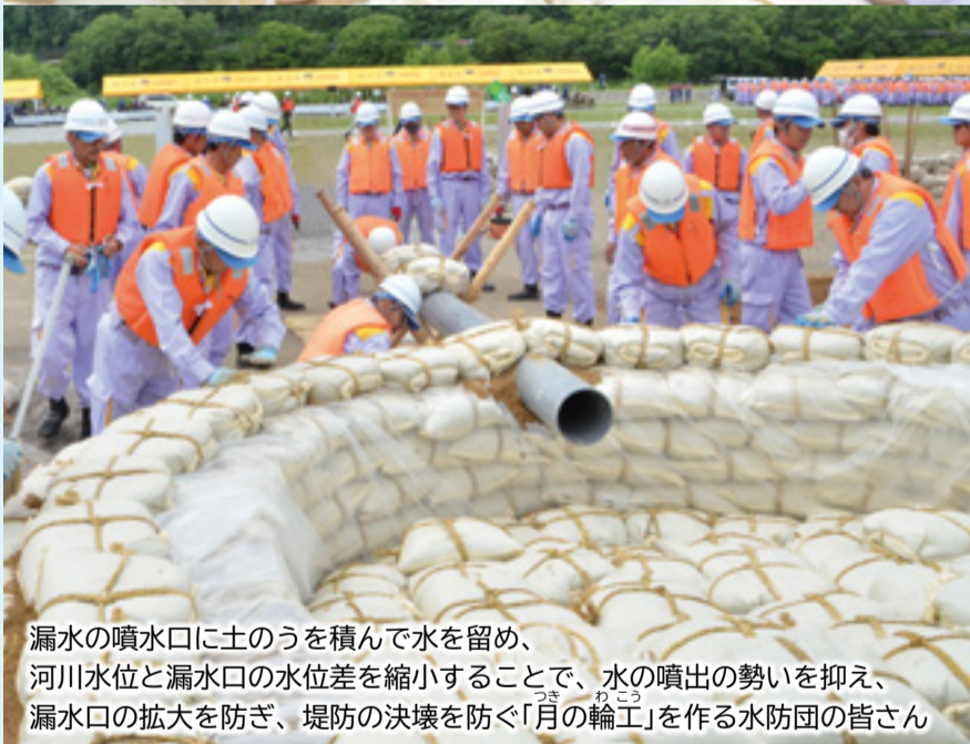
漏水の噴水口に土のうを積んで水を留め、河川水位と漏水口の水位差を縮小することで、水の噴出の勢いを抑え、漏水口の拡大を防ぎ、堤防の決壊を防ぐ「月の輪工」を作る水防団の皆さん