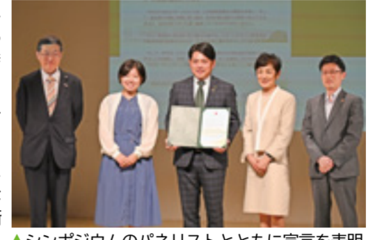
▲シンポジウムのパネリストとともに宣言を表明

市は、5月18日に開催したシンポジウムにおいて、2050年までに温室効果ガスであるCO 2 (二酸化炭素)の排出量を実質ゼロ*にすることを旨とし、「ゼロカーボンシティ」の実現にチャレンジする、「岐阜市ゼロカーボンシティ宣言」を表明しました。 *実質ゼロとは、経済活動などにより人為的に排出される温室効果ガスと、森林保全や植林などによって吸収される温室効果ガスの量を均衡させ、実質的な排出をゼロにすること。