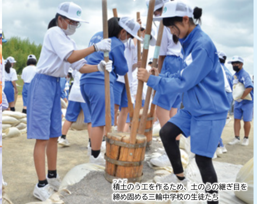
つみど 積土のう工を作るため、土のうの継ぎ目を締め固める三輪中学校の生徒たち