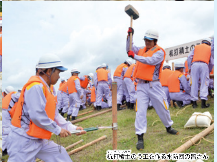
つみど 杭打積土のう工を作る水防団の皆さん

市では、豪雨災害などの発生を想定し、地域の皆さんを守るため、水防団が活躍しています。5月28日に行われた「第54回岐阜市水防連合演習」では、34の水防団に加え、三輪中学校および東長良中学校の生徒たちの演習参加や、長良東小学校の児童の見学など、総勢約2,400人が参加しました。演習では、堤防被害の拡大を防止する「月の輪工」など実践的な工法のほか、水防活動支援情報共有システムの実証実験など、新たな演習も取り入れ、災害対応力の向上を図りました。近年、全国各地で甚大な災害が発生しています。命を守るため、一人一人が防災意識を高め、災害へ備えましょう。☎水防対策課☎214-4854