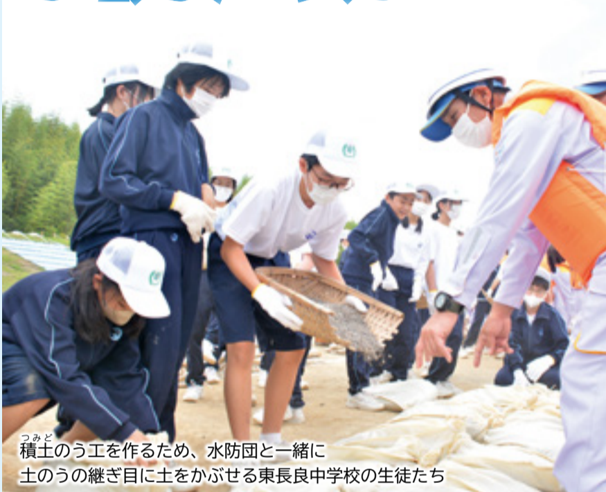
つみど 積土のう工を作るため、水防団と一緒に土のうの継ぎ目に土をかぶせる東長良中学校の生徒たち