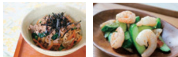
▲野菜たっぷりビビンバ丼 ▲きゅうりとエビのソテー

市ホームページ(HP 1004315)で低栄養予防レシピ26種をご覧ください。また、各保健センターや市庁舎1階で冊子を配布しています。