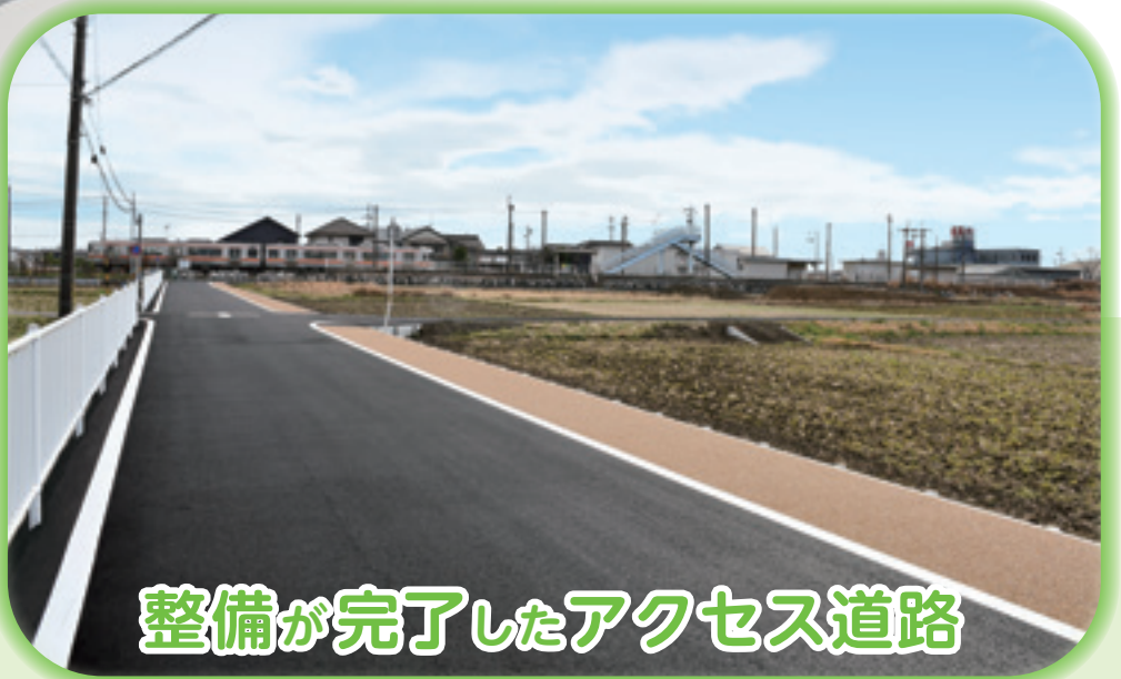
整備が完了したアクセス道路