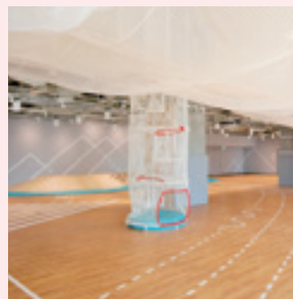
きッズエリアの様子