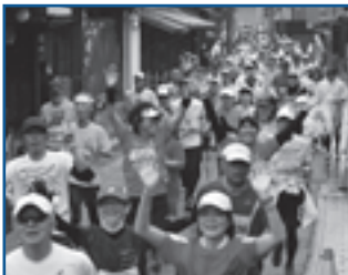
川原町の古い町並み