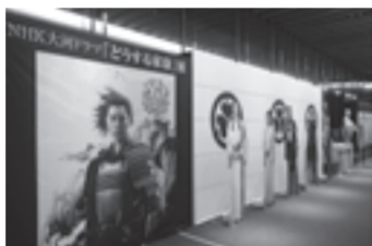
NHK大河ドラマ「どうする家康」展・ぎふ 関ヶ原 主催：(一財)NHKサービスセンター