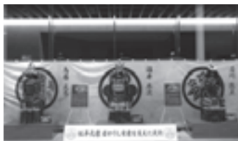
家康、命運の地 関ヶ原展 主催：岐阜県

徳川家康ゆかりの武将の甲冑を展示した企画展を開催中です。また、大河ドラマ「どうする家康」の出演者等身大パネルやサイン、衣装の展示など、ドラマの世界観を体験できる企画展も併せて開催しています。