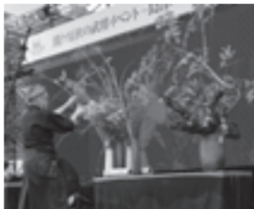
花いけバトル(令和元年)