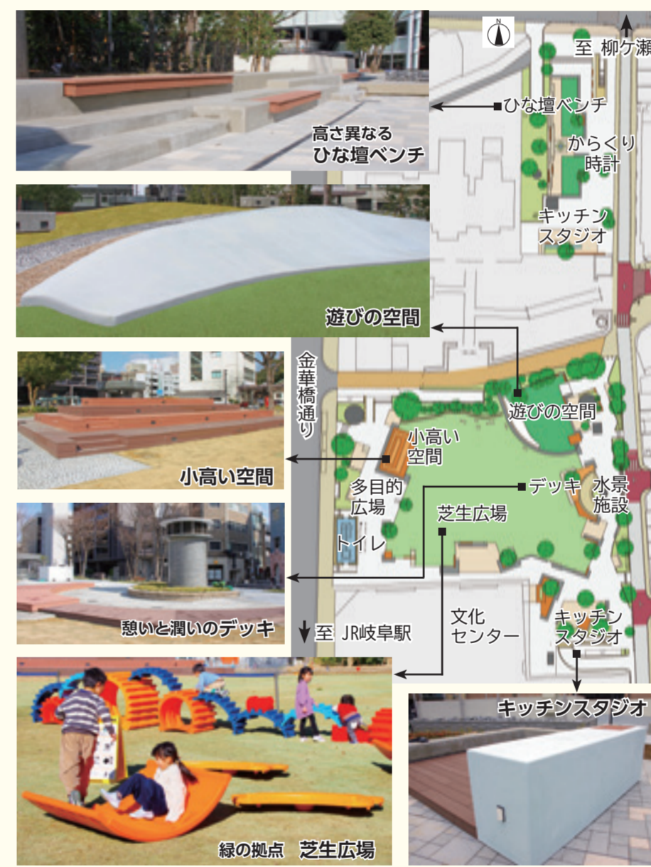
※移動式遊具は休日などに設置