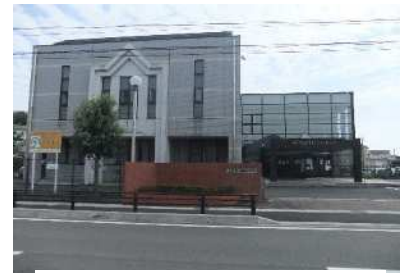
（長森コミュニティセンター）