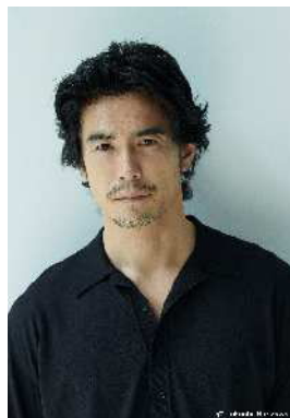
「福富平太郎貞家役」 伊藤 英明さん