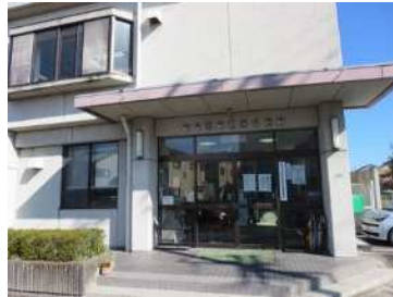
（長森南連絡所 長森南公民館内）