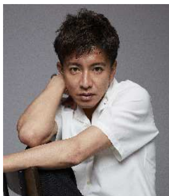
「織田信長公役」 木村 拓哉さん

「②映画「THE LEGEND & BUTTERFLY」公開記念トークイベント」に出演。