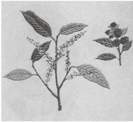
市の木「つぶらじい」