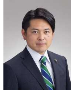
岐阜市長 柴橋 正直