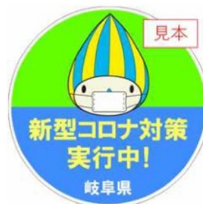
with コロナステッカー