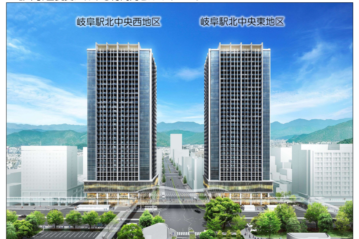
※上図は準備組合が示した参考図であり、今後の進捗状況により、外観や床構成等を含む建築計画等は変更になる場合があります。また、前面の歩行者用デッキはイメージであり、本地区の再開発事業の整備には含まれておりません。