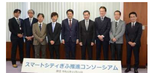
スマートシティぎふ推進コンソーシアム 設立 令和元年11月11日