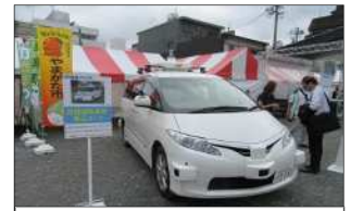
自動運転車両の展示