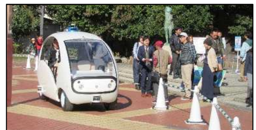
自動運転車両走行実験