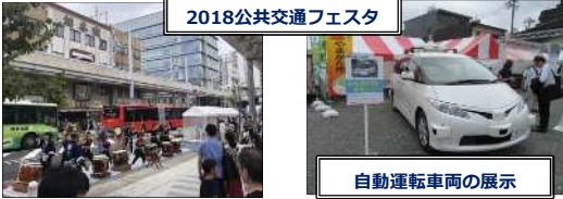
自動運転車両の展示