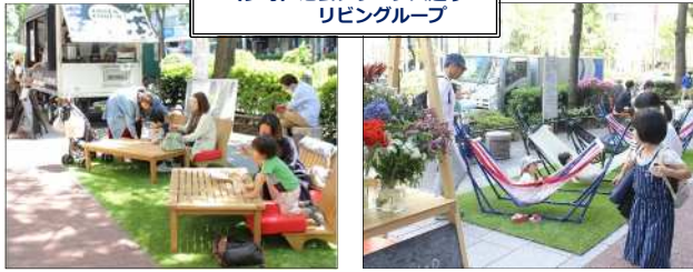
(参考) 池袋グリーン大通りリビングループ