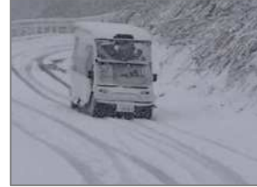
⑦秋田県上小阿仁村