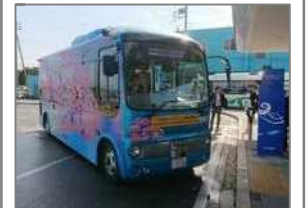
④茨城県日立市 SBドライブ