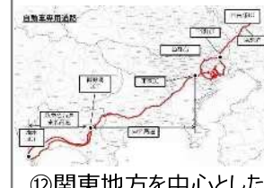
⑫関東地方を中心とした 高速道路、東京臨海 地域周辺等

⑬ ・臨海副都心地域（一般道） ・羽田空港地域（一般道） ・羽田空港と臨海副都心等を結ぶ首都高速道路（一般道を含む）