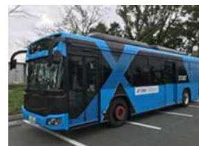
⑪沖縄県那覇市及び豊見城市 間の幹線道路を中心としたエリア