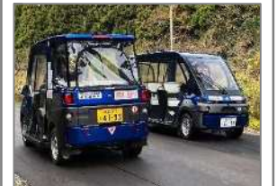
②福井県永平寺 産総研