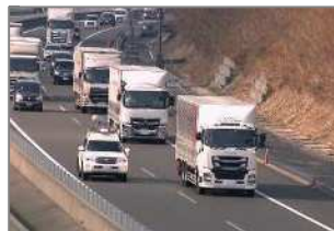
⑭新東名高速道路 豊田通商、先進モビリティ等