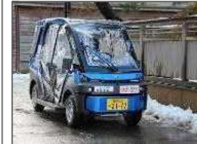
①石川県輪島市 産総研