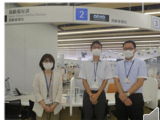
センターの窓口（高齢福祉課内）