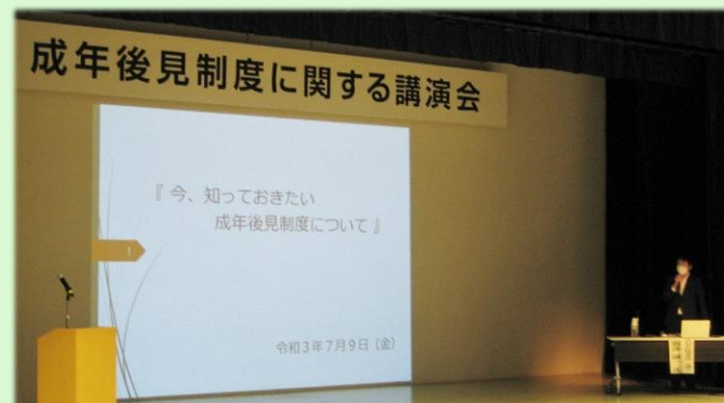
開設記念講演会の様子