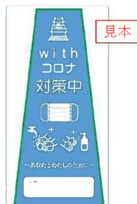
with コロナステッカー

また、感染防止対策を実施した店舗では、「with コロナステッカー」や「新型コロナ対策実施中！ステッカー」を掲示し、感染防止の徹底の自己宣言と利用者への注意喚起を行うよう、呼びかけていく。