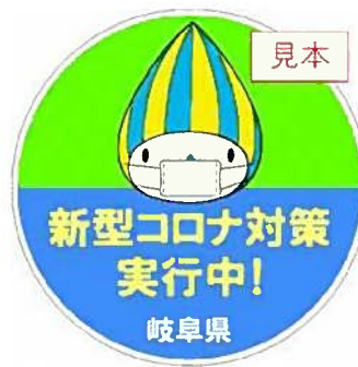
新型コロナ対策実施中！ステッカー