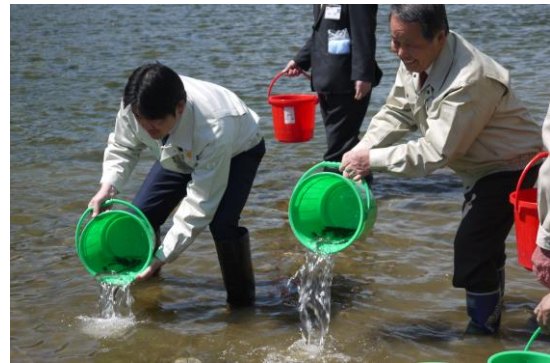
アユの放流（長良川）

カワウ対策については、岐阜県カワウ被害対策指針に基づき調整・研究を進めています。