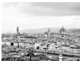
姉妹都市／フィレンツェ市

盟約調印年月日 昭和53年2月8日 国名 イタリア共和国 人口 約36万人 面積 102km 2 気候 地中海性気候 産業・特産物等 手工芸品・ファッション・観光産業