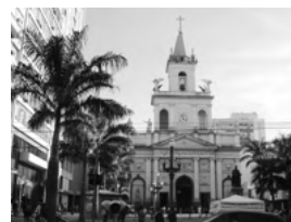
姉妹都市／カンピーナス市

盟約調印年月日 昭和54年2月21日 国名 中華人民共和国 人口 約1,194万人 面積 16,596km 2 気候 モンスーン性気候 産業・特産物等 茶・生糸・絹織物・観光・IT産業