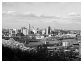
姉妹都市／シンシナティ市

盟約調印年月日 昭和57年2月22日 国名 ブラジル連邦共和国 人口 約121万人 面積 796km 2 気候 サバンナ性気候 産業・特産物等 IT産業・電気機械類・農業