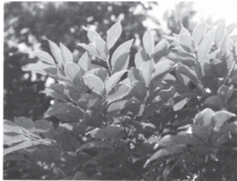
市の木 つぶらじい

この地は古くは「井の口」と呼ばれ、織田信長が「岐阜」の名を全国に広めた。この由緒あるいわれに基づき、「井の口」の「井」をもって本市の市章と定めたものである。 (明治42年8月27日制定)