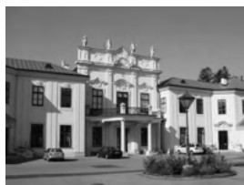
姉妹都市／ウィーン市 マイドリング区

盟約調印年月日 昭和63年5月11日 国名 アメリカ合衆国 人口 約30万人 面積 206km 2 気候 大陸性森林気候 産業・特産物等 機械・化学工業