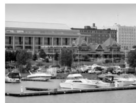
姉妹都市／サンダーベイ市

盟約調印年月日 平成6年3月22日 国名 オーストリア共和国 人口 約10万人 面積 8.2km 2 気候 西岸海洋性気候 産業・特産物等 商店街の共存する住宅地