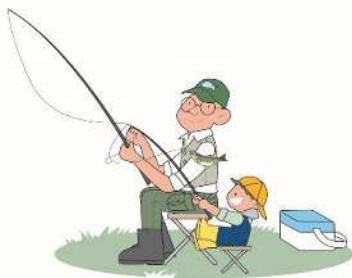
育児休業制度の充実

少子化や高齢化など、いくつもの課題の解決に向け、男女が対等のパートナーとして、お互いに知恵を出し合うとともに責任を分かち合える社会の早期実現が求められています。