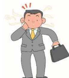
時間外労働の削減