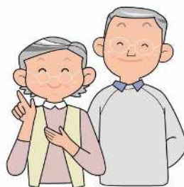
介護休業制度の導入