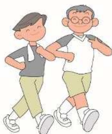
ワーク・ライフ・バランス